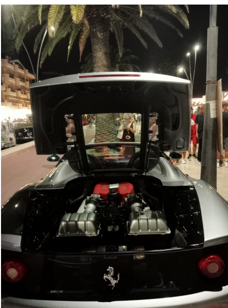
Roseto degli Abruzzi. Un successo oltre ogni rosea aspettativa per gli organizzatori del 7° raduno di auto e moto d'epoca "Sulle Strade delle Rose". L'evento, patrocinato dalla Città di Roseto degli Abruzzi ed organizzato dal Auto Moto Storico