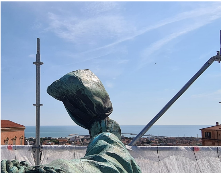
Re Vittorio Emanuele II