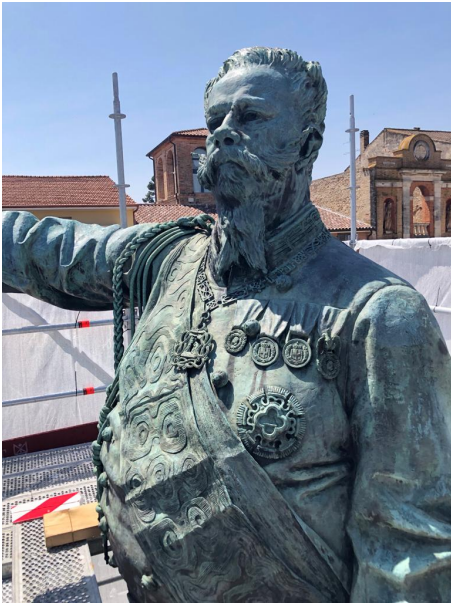
Re Vittorio Emanuele II

migliori coordinate entro cui collocare, esaminare e rendere intelligibile la complessa vicenda del Vittorio Emanuele II di Giulianova e del suo autore.