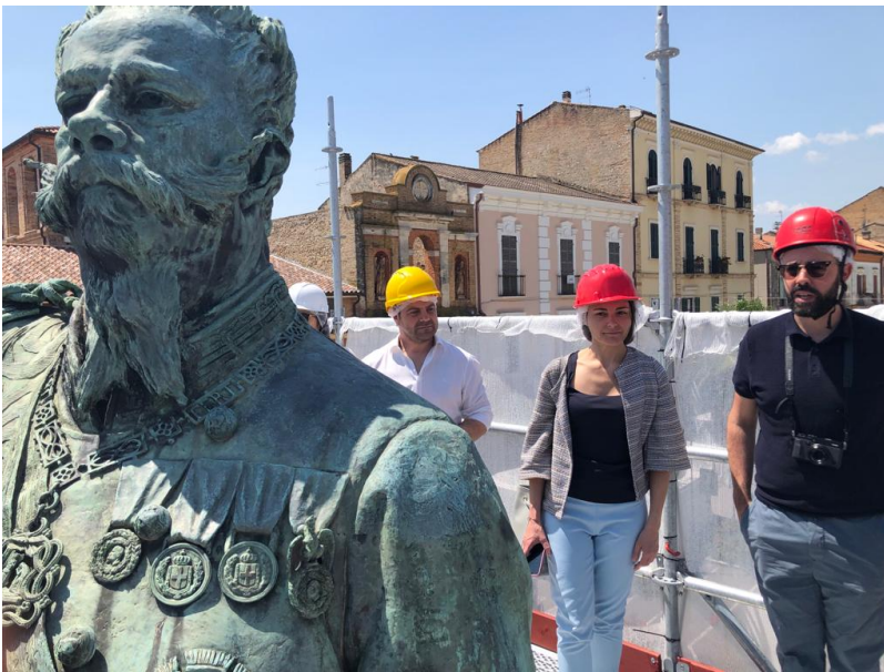
Re Vittorio Emanuele II