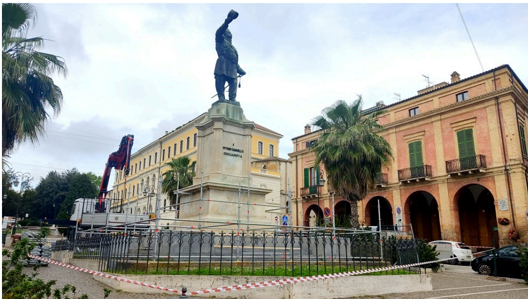
Piazza della Libertà, Vittorio Emanuele II