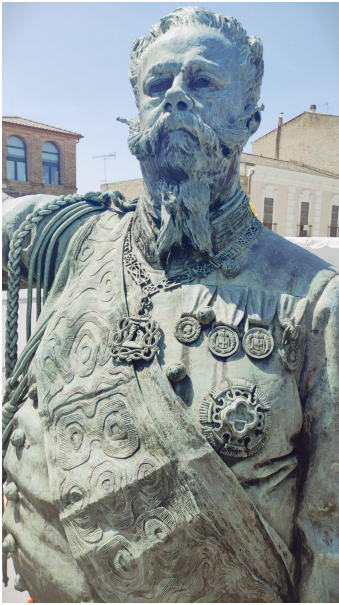
Re Vittorio Emanuele II