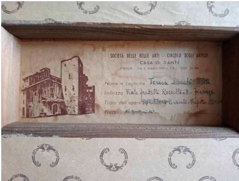
Elmo Bracali, Prefetto