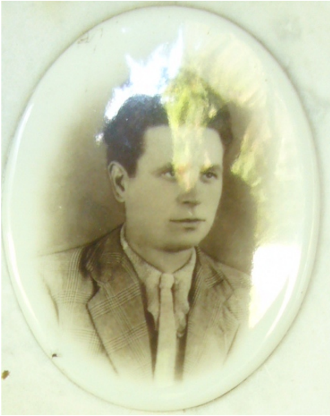
Concetto Zenobi cortesia . Charlotte Lugmayr-Frantz