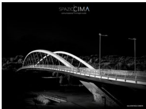
Raffaele Canepa (3)