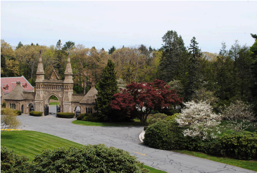
Forest Hills Cemetery fonte pagina facebook