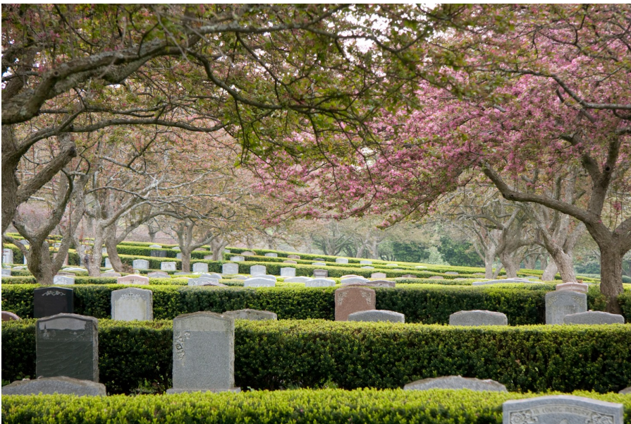
Forest Hills Cemetery