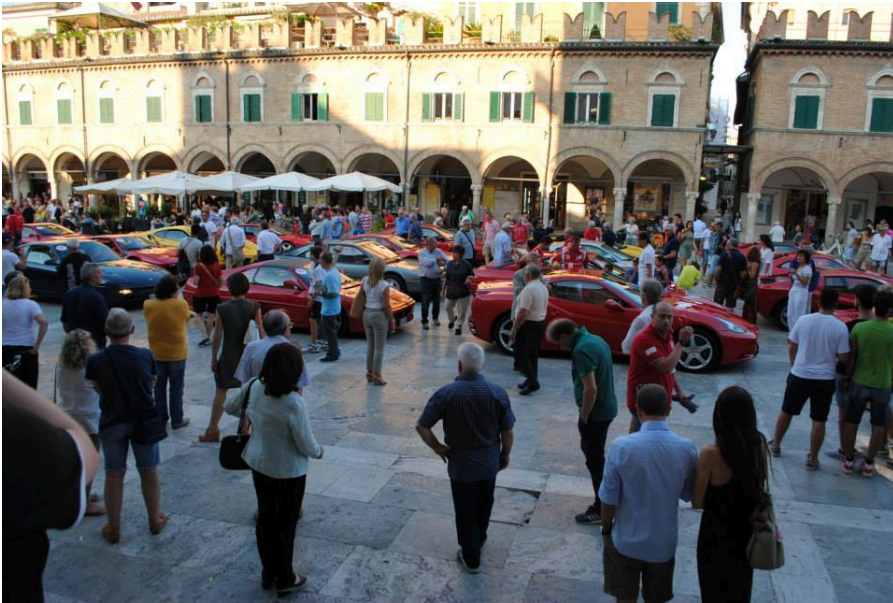
Ascoli 2014 Raduno Ferrari