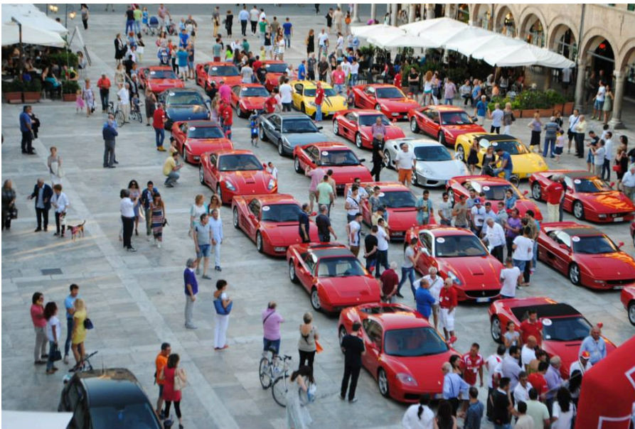
Ascoli 2014 Raduno Ferrari